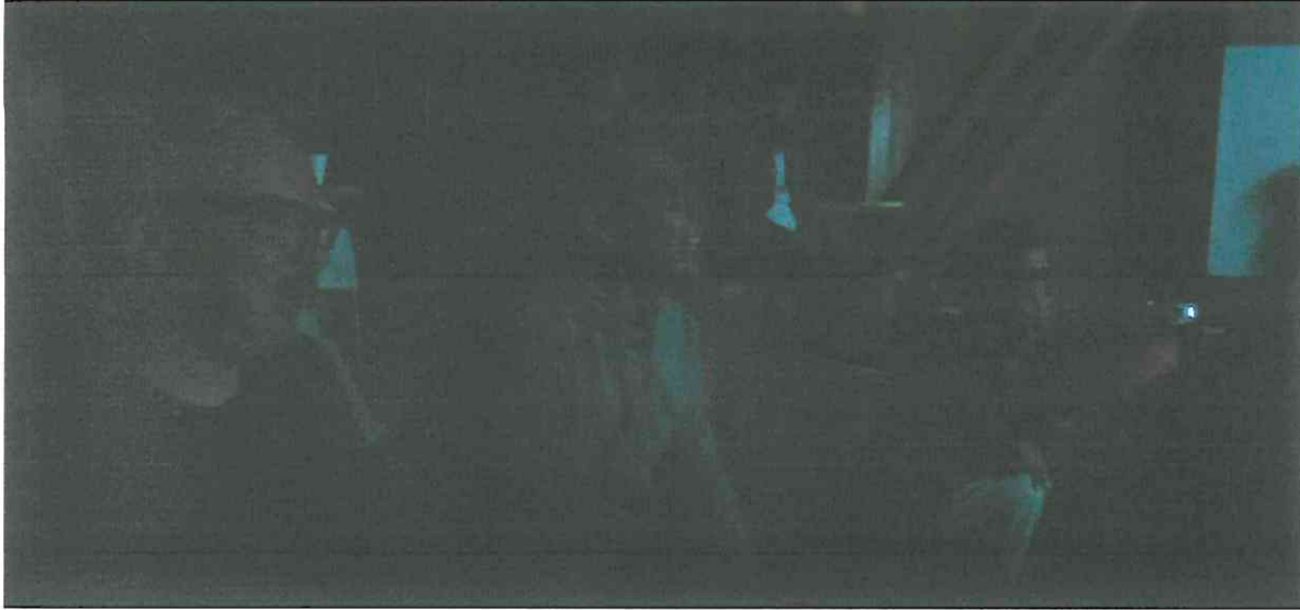
Publico presente en la presentación de la Muestra Espacios 2023, en la cual fue presentada el documental Búfalo Volador.