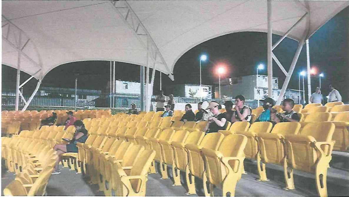
Publico presente en la presentación de la Muestra Espacios 2023, en la cual fue presentada el documental Búfalo Volador. En el teatro al aire libre del Parque La Paz "Carlos el Pescadito Ruiz".