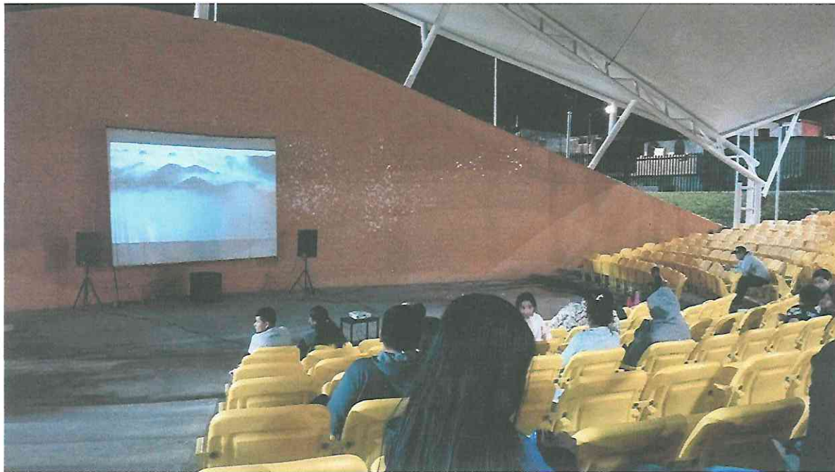
Escena de nubes en Campur del Documental Búfalo Volador, presentado en el teatro al aire libre del Parque La Paz “Carlos el Pescadito Ruiz”.