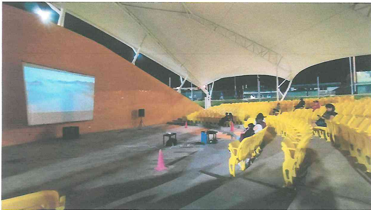
Escena de nubes en Campur del Documental Búfalo Volador, presentado en el teatro al aire libre del Parque La Paz "Carlos el Pescadito Ruiz", parte de la muestra Espacios.