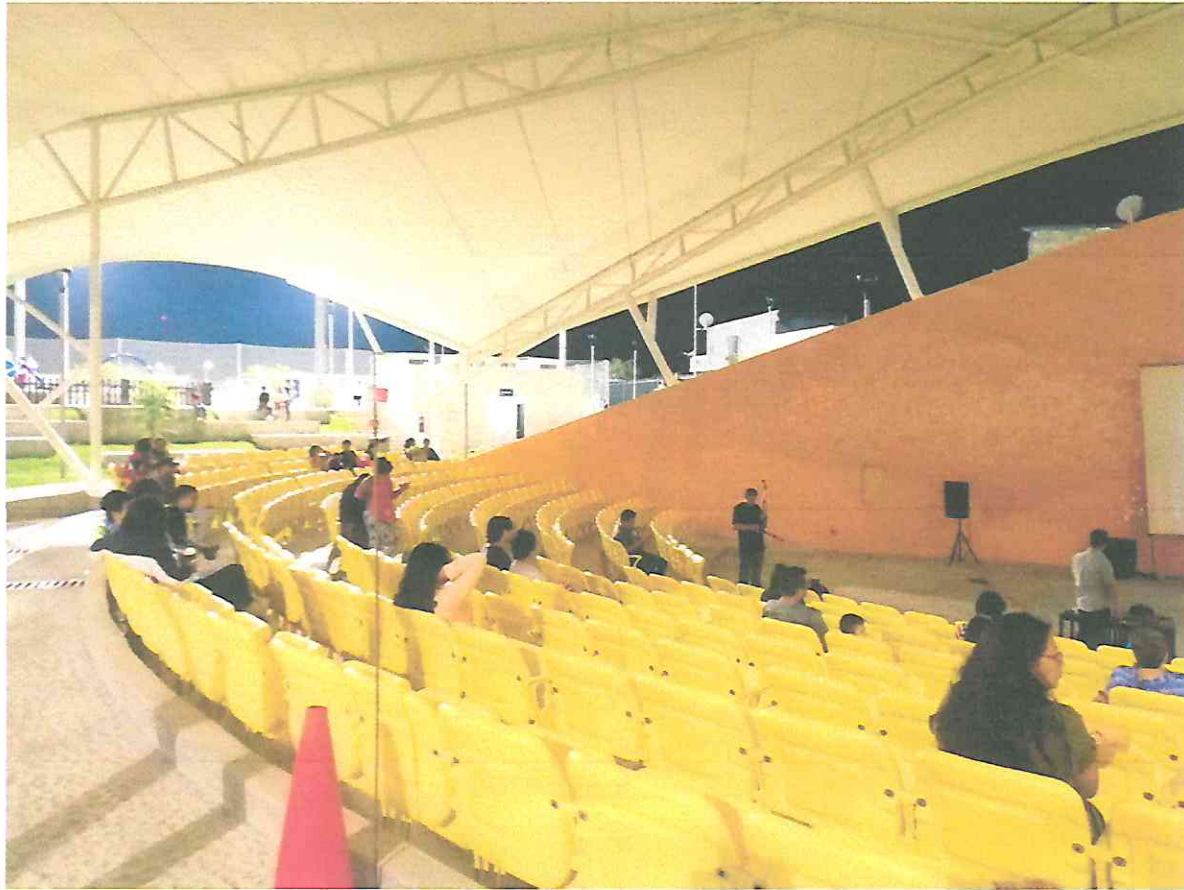
Publico presente en la presentación de la Muestra Espacios 2023, en la cual fue presentada el documental Búfalo Volador. En el teatro al aire libre del Parque La Paz "Carlos el Pescadito Ruiz".